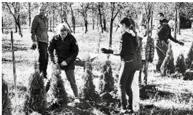
Radnim dogovorom obeležen Dan volontera

upravljanje poljoprivredom za zdravu životnu sredinu' uz podršku američke agencije za međunarodni razvoj (USAID) i Vlade Ujedinjenog Kraljevstva u okviru programa podrške javnom govaranju 'Istraži – Osnaži', koji sprovodi Trag fondacija. Podrška je stigla i od naših poslovnih partnera: Fabrike šećera Crvenka, Sunoko, Vital, Karneks i PIK Bačka Topola", - saopštili su iz Ekološkog pokreta Vrbsa.