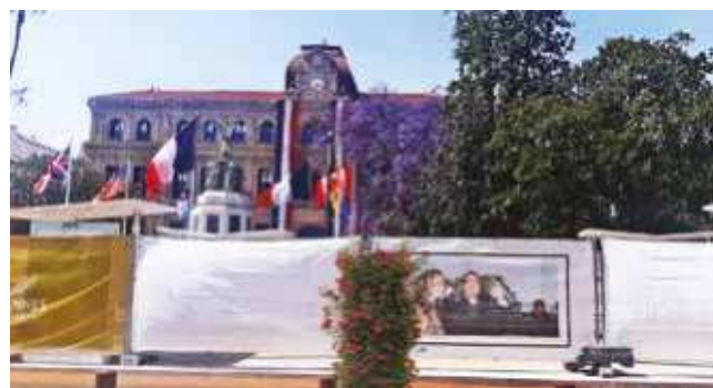
Dom Filmskog festivala

Ako ste iz Srbije ne zaboravite da prošetate i Srpskom ulicom (Rue De Serbs). Zanimljiva je priča kako je ova ulica dobila ime. U toku Prvog svetskog rata u Kansku luku uplovio je brod sa srpskim ranjenicima. Sa broda, zaprežnim kolima, ranjenici su prevoženi do bolnice, koja se nalazila na kraju ove ulice. Vest se brzo pročula po gradu. Građani Kana su masovno izašli na ulicu, stvorivši špalir duž celog puta do bolnice. Klicali su hrabrim srpskim vojnicima. Sa sobom su poneli hranu, vodu, garderobu i naravno cveće za heroje. Nisu se razišli dok i poslednji srpski ranjenik nije smešten u bolnicu. Za vreme boravka naših ranjenika u bolnici, građani Kana su ih često obilazili donoseći im poklone, iskazujući svoje divljenje za njihovu hrabrost i čineći sve da im boravak u Kanu učine što podnošljivijim. Zanimljiva činjenica je da je devedesetih godina prošlog veka bio raspisan referendum sa predlogom da se njeno ime promeni, ali su stanovnici Kana odbili predlog i tako ostali privrženi istorijskom prijateljstvu između dva naroda.