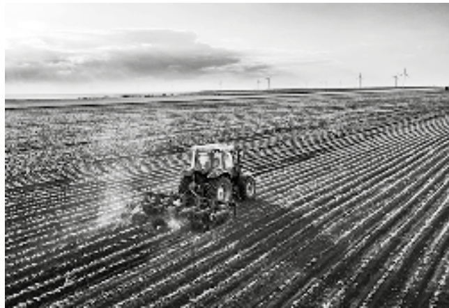
Reč je o više hiljada hektara

da sporovi nedopustivo dugo traju i da su zemljoradničke zadruge oštećene za decenije neraspologanja sopstvenom imovinom, dok sa druge strane, privatizacije ni na koji na-