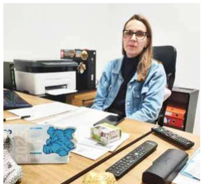
Rani buking za more