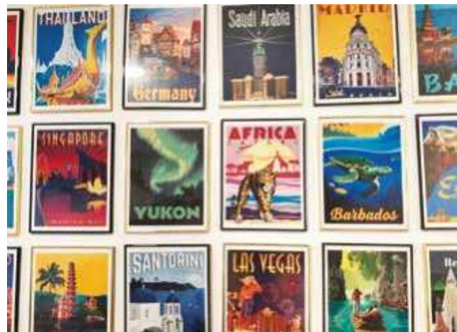
U najavi poskupljenja

“Prošle sezone najviše interesovanja kada je u pitanju zimski turizam naši ljudi imali su za Divčibare i za Zlatibor. Takođe welnes i banjski turizam manje su zastupljeni sem odlazaka u mađarske banje Mora Halom i Harkanj za koje organizujemo jednodnevni boravak”, kaže Arambašić. Dodajući da su se ove godine tokom letnje sezone najbolje prodavali Turska, Egipat i Tunis, kao i Crna Gora. “Nedavno je održan Sajam