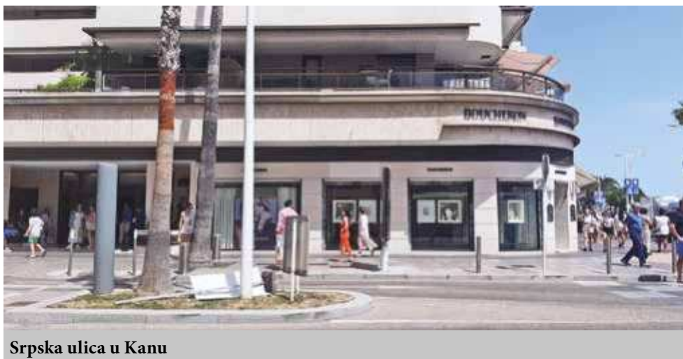
Srpska ulica u Kanu

na koji možete da se popnete odavde su odlčni pogledi na čitav Kan i okolinu. U koliko vas put nanese u Kan da znate da je sve blizu i za par sati možete obići i videti sve znamenitosti grada.