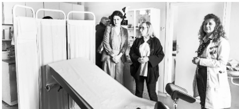
Prijavite seksualno nasilje

(47%), zatim članovi porodice (19%), a potom bračni ili vanbračni partneri (12%). Centri za žrtve seksualnog nasilja su osnovani 2016. godine i pružaju specijalizovanu uslugu podrške koja se ne pruža ni u jednoj zdravstvenoj ustanovi u regionu Zapadnog Balkana, a u Republici Srbiji samo u okviru pet zdravstvenih ustanova u AP Vojvodini, u opštim bolnicama u Kikindi, Zrenjaninu, Sremskoj Mitrovici, kao i Klinici za ginekologiju i akušerstvo Kliničkog centra Vojvodine, a od sada i u Opštoj bolnici Vrbas. Njihovo uspostavljanje predviđeno je Istanbulskom konvencijom koju je Republika Srbija ratifikovala 2013. godine, a omogućavaju ženama i devojčicama da prevaziđu traumu doživljenog iskustva seksualnog nasilja i nastave život bez nasilja.