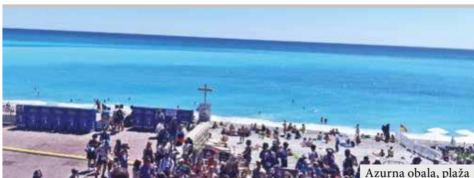
Azurna obala, plaža

■ Nica je najveće naselje Rivijere, i peti grad u Francuskoj po veličini, a drugi u francuskoj Sredozemnoj obali. Veoma je značajna turistička destinacija, drugi je grad u Francuskoj po veličini smeštajnih kapaciteta, sa 4.500 m plaža, najposećeniji je grad Rivijere i drugi grad u Francuskoj po učestalosti turističke posete, posle Pariza. Ima preko 200 hotela i 15.800 apartmana.