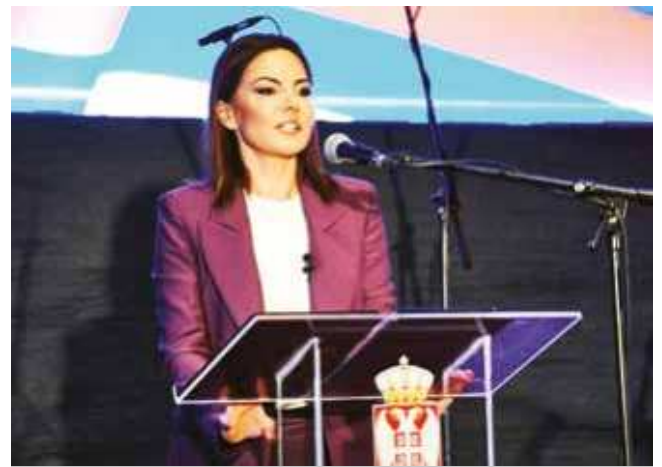
CFK ovogodišnji dobitnik Oktobarske nagrade