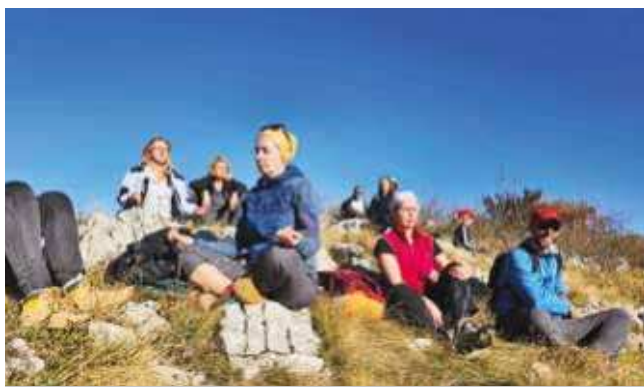
Joga menja pristup životu

Zvučne relaksirajuće masaže po metodi Peter Hes su jedinstveno iskustvo. Koriste se isključivo ručno rađene činije sastavljene od 12 legura metala koje svojim nežnim vibracijama opuštaju, revitalizuju i regenerišu telo. Nežne zvučne vibracije preko kože i spinalnih nerava putuju telom i otklanjaju nakupljene blokade stvarajući osećaj duboke opuštenosti. Ovu metodu je Petar Hes počeo razvijati 1984. godine u Nemačkoj. Joga nidra, takođe tehnika duboke opuštenosti, u Joga studiju Yogistan u Kuli oplemenjena je zvucima činija, gonga i instrumenata čija harmonija zvuka dovodi balans i ravnotežu u našu svakodnevicu. Kupanje zvukom pomaže u otklanjanju svakodnevnog stresa današnjice.