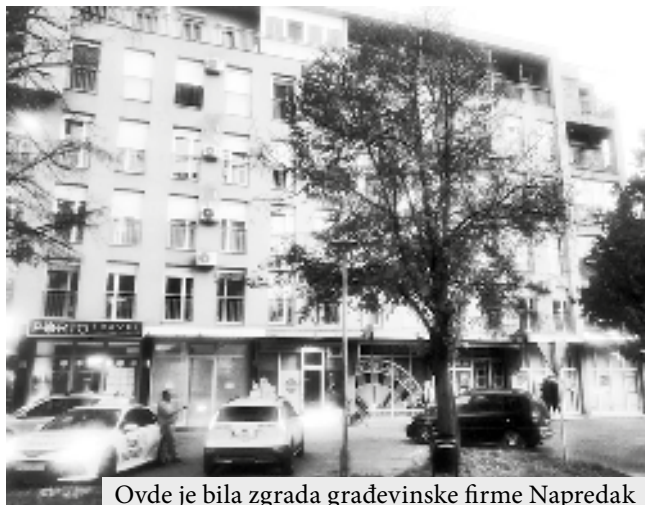
Ovde je bila zgrada građevinske firme Napredak

je za utehu ostale su velike firme, koje su takođe privatizovane, koje i danas rade, u kom su stanju najbolje znaju oni koji su ih kupili. Izvesno je da grad više nije industrijsko prehrambeni gigant, ka-