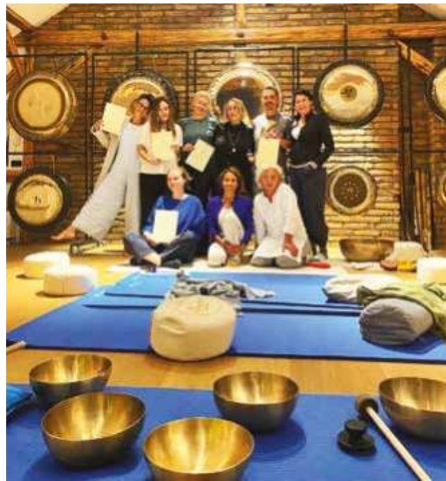
Zvučna masaža je jedinstveno iskustvo

nik i sertifikata Peter Has Akademije Adria Grupe, Centra za zvukoterapiju iz Zagreba".