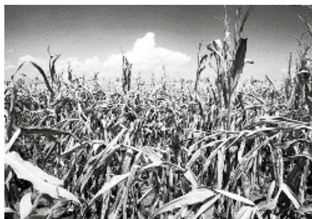
Komunikacija poljoprivrednika sa vlastima