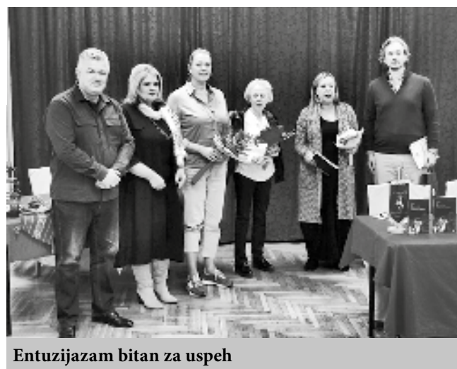
Entuzijazam bitan za uspeh