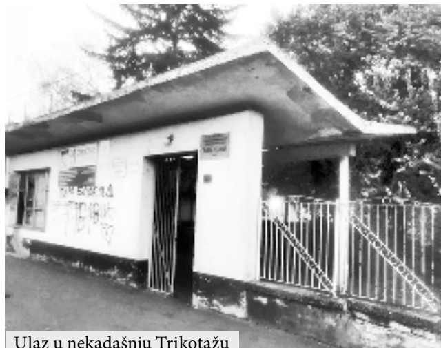
Ulaz u nekadašnju Trikotažu

je uspešna jer je imala radnike i ekipe koje su radile čak i u inostranstvu na primer u Rusiji. Danas su građevinski radnici i graditelji neki manje ili više kvalifikovani majstori, radnici koji dolaze čak iz inostranstva iz dalekih zemalja, a investitori objekata su uglavnom privatnici ili prosto rečeno svi oni koji imaju love. Na mestu nekada ugledne firme gde je bila zgrada u samom centru grada sa administracijom firme odavno je izgrađena