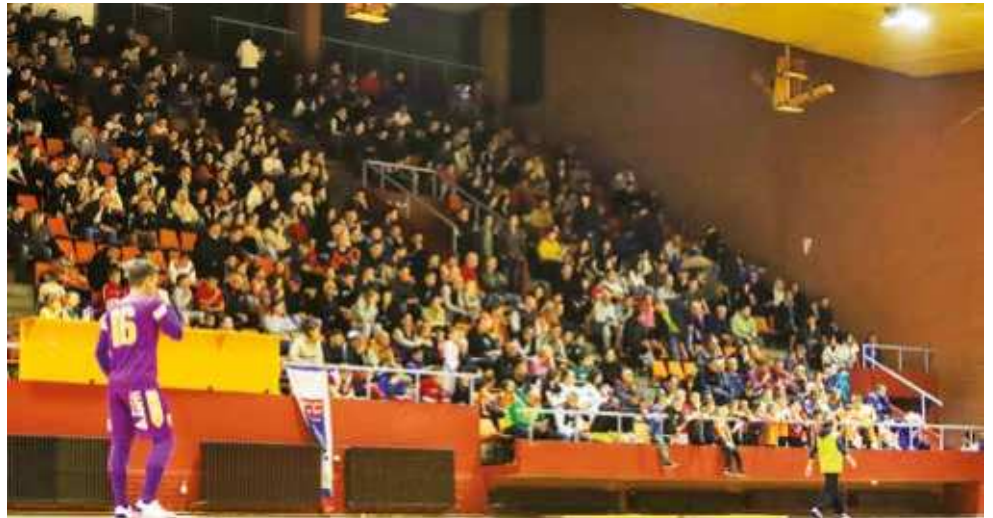
Dvorana je "eksplozirala"