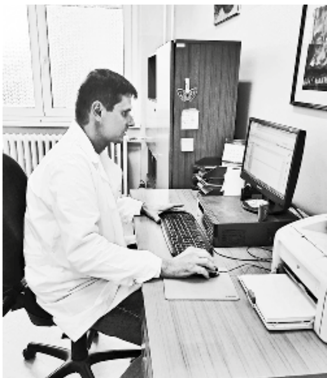
U porastu su bolesti zavisnosti

Porodica je izgubila ulogu koju je nekada imala. Takođe se može primetiti da nam se preko sredstva javnog informisanja nameću nasilje, vulgarnosti, promiskuitet i pogrešan sistem vrednosti uopšte“.