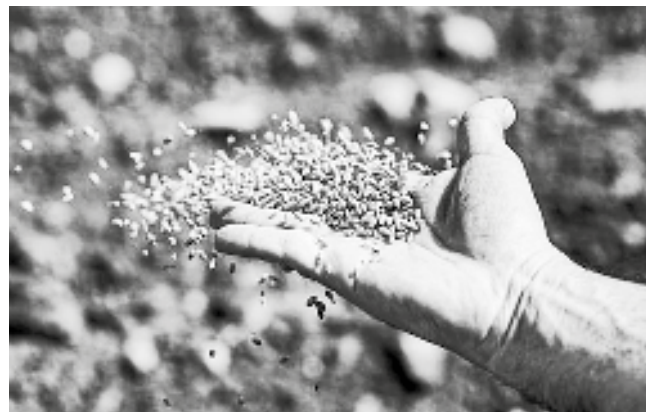
Zbog besparice nedeklarisano seme

družnom savezu Vojvodine ne znaju koliko će ratarima trebati novca po hektaru za setvu. Osim što smatraju da će biti skuplja za pet do šeset procenata nego lane.