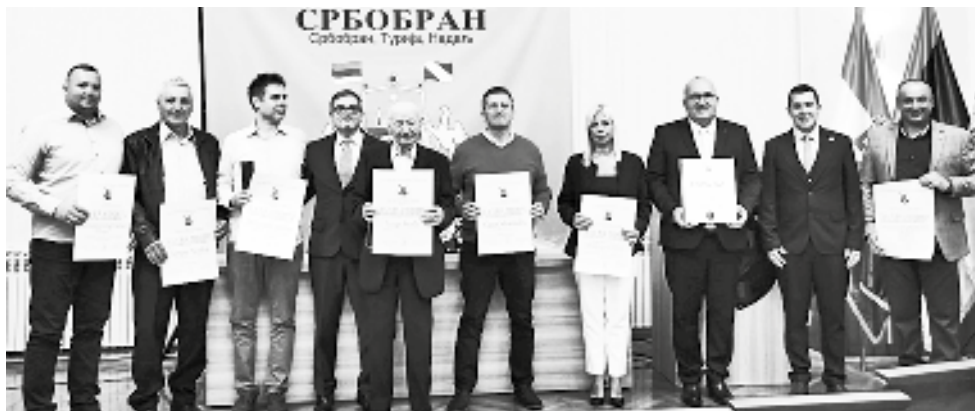
Ovogodišnji laureati su:

paora, omiljenog lekara u svojoj lokalnoj zajednici, ali ni vredne prosvetne radnike koji se marljivo trude da nauče našu decu i izvedu ih na pravi put“, istakao je Debeljački.