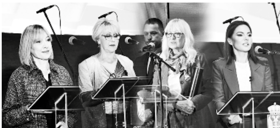
Ovogodišnji dobitnici Oktobarske nagarde su:

u ovim pitomim vrbaskim poljima sloboda je zasadi- la svoje znamenje. I svaki stanovnik naše opštine ga podupire snagom svog srca punih 80 godina. Ta ustalasana zastava slobode koja lebdi nad našim glavama je temelj našeg prosperiteta,