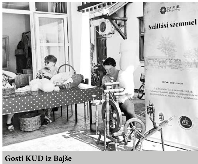
Gosti KUD iz Bajše

Manifestacija je ove godine bila uveličana i prisustvom KUD "Bratstvo" iz Bajše. Članovi sekcije lukara i strelčara iz ovog Kulturno-umetničkog društva postavili su nomadski šator, jurtu koja je bila prava atrakcija. Pažnju su privukli i prikazom veština u rukovanju lukom i strelom, kao i prikazom drugog naoružanja i alata kojima su pokušali da što je moguće autentičnije dočaraju život nomada, Avara, Huna i drugih plemena.