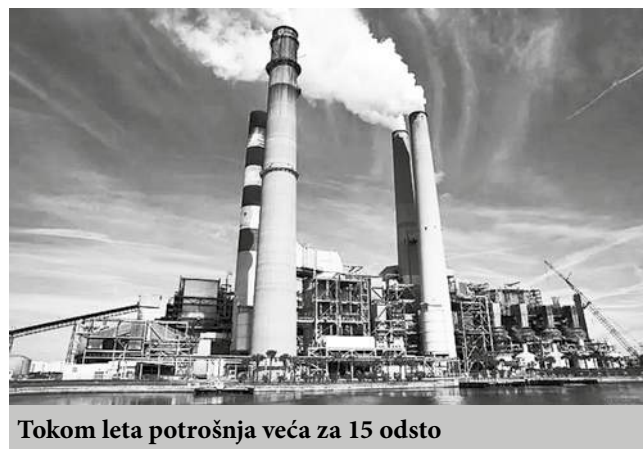
Tokom leta potrošnja veća za 15 odsto

drugi naredne, čime ćemo imati potpuno obnovljenih više od 600 megavata koji našem sistemu daju značajnu energetske sigurnost“, rekao je Živković.