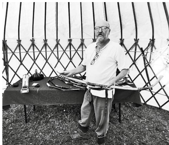
Slike nomadskog života

Bajše. Prateći programi ovih manifestacija su organizovani i za decu kroz predstave i igraonice.